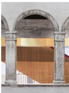
El MERCADER de Venecia