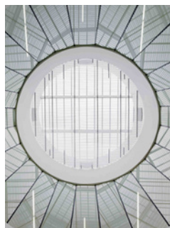
Arquitectura serena PREMIADA