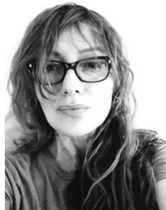
ENSAYO para una DEGRADACIÓN