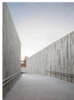
Bienvenidos al SIGLO XXI