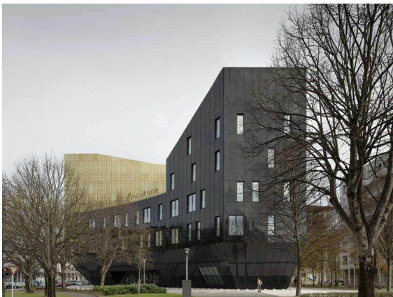
EL EDIFICIO SE MUESTRA CON ROTUNDIDAD HACIA LA CARRETERA.

Esa chapa dorada, que ilumina los espacios interiores tamizando la luz exterior, mantendría la idea de los patios áureos brillantes que reciben a los vehículos desde la entrada a San Sebastián que es la Avenida de Tolosa.