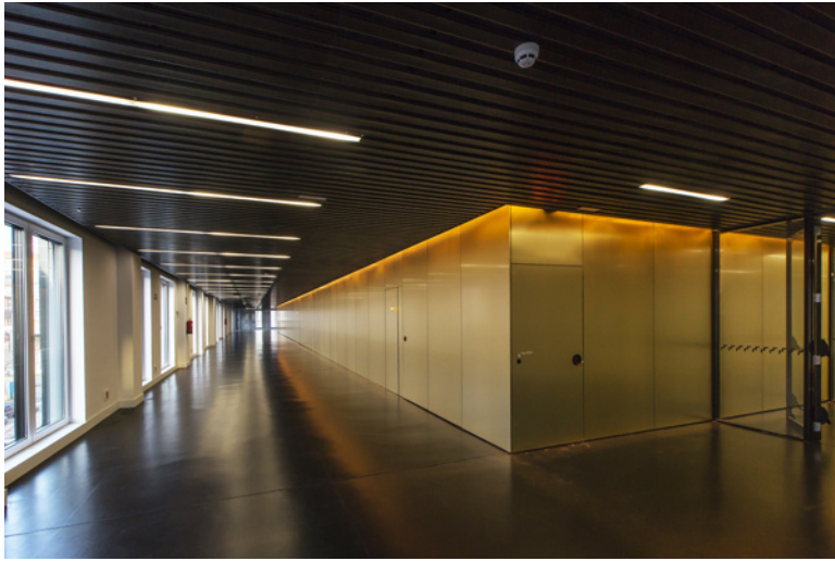
EN EL INTERIOR, TAMBIÉN EL NEGRO HACE CONTRASTAR EL CORAZÓN DORADO.

arquitectos, se ha prescindido de “todo lo accesorio y superfluo” para “concentrarse en lo esencial, en aquello que aporta verdadero valor al edificio”.