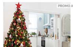
¿Vestimos la casa de FIESTA?