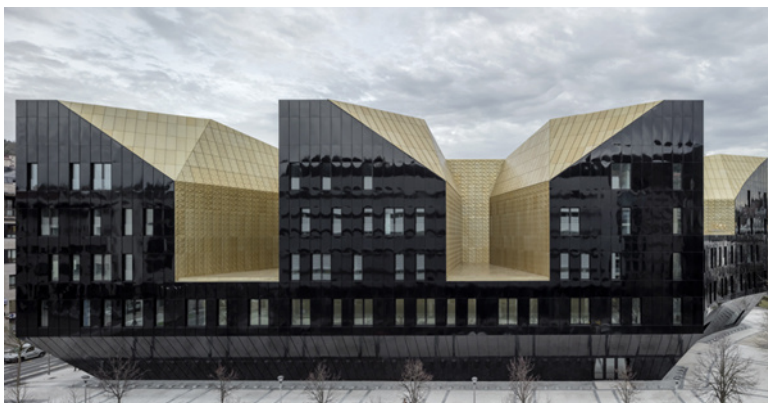
LA GRAN JOYA TALLADA QUE ES EL MUSIKENE.

Debido a la forma del solar, de anchura considerable, y de cara a garantizar la iluminación natural de todas las dependencias, el edificio se fue horadando creando patios que asomaban al exterior. Ese juego de tallado del gran volumen se repitió también en altura, convirtiéndose en la génesis del proyecto: una gran masa oscura que se talla, por donde asoma un interior luminoso, como si de una gran geoda se tratase.