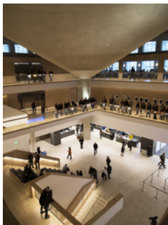
Nuevos TEMPLOS culturales en Londres (I)