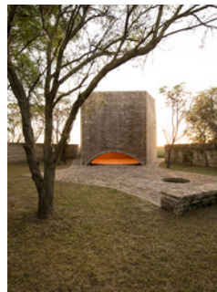
La MÍSTICA de la luz