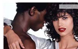
Tom Ford, CREADOR de iconos