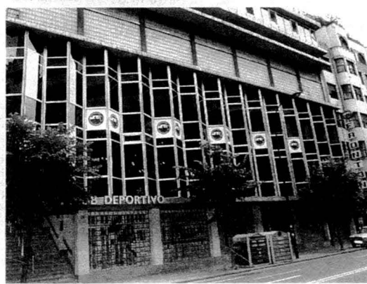
Fachada actual del Deportivo en Alameda de Rekalde que data de 1964.